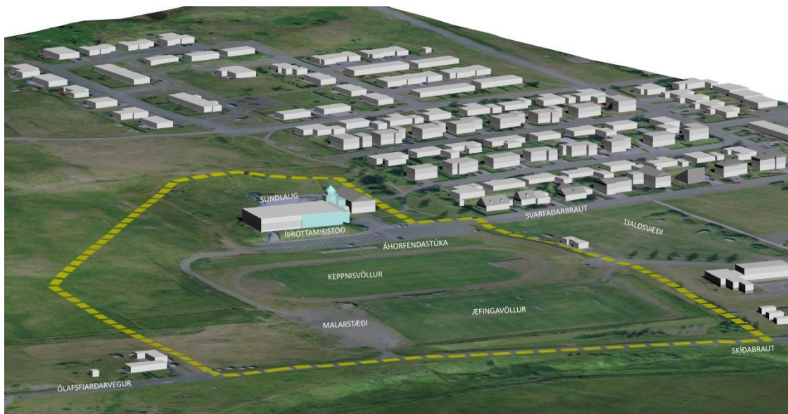
Mynd 3: Einfalt landlíkan sem skýrir núverandi staðhætti innan skipulagsmarka.

Knattspyrnuvöllir eru tveir, aðalvöllur fyrir keppnisleiki og æfingavöllur. Keppnisvöllur er flokkaður í D-flokk hjá KSÍ en báðir vellar eru grasvellar. Áhorfendastúka með 104 sætum er vestan við aðalvöll en austan við eru tvö varamannaskýli, hvort fyrir 12 leikmenn. Aðstaða fyrir frjálsar íþróttir er úr sér gengin.