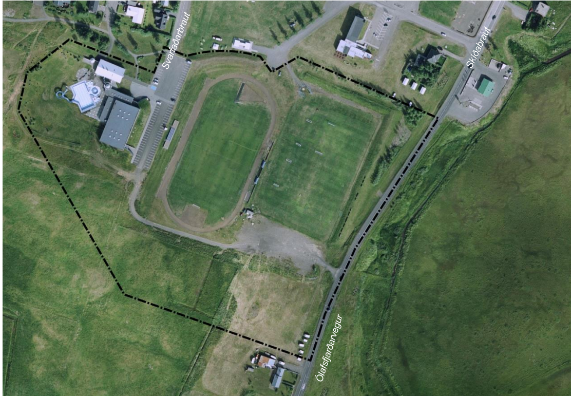
Mynd 1: Loftmynd af skipulagssvæði, brotalína sýnir skipulagsmörk 8,4 ha.

Skipulagssvæðið er sunnan núverandi byggðar á Dalvík og mótar andlit bæjarins til suðurs. Afmörkun til austurs miðast við miðlínu Ólafsfjarðarvegur og Skíðabrautar, að norðan við lóðamörk Skíðabrautar 18 og 20 og tjaldsvæði. Skipulagsmörk ná vestur fyrir sundlaugarsvæði íþróttamiðstöðvar Dalvíkurbyggðar og suður um óbyggt land að Ásgarði. Skipulagssvæðið er 8,4 hektarar.