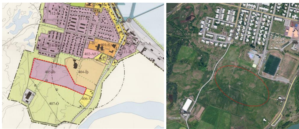
Mynd 2 Til vinstri, mynd úr aðalskipulagi Dalvíkurbyggðar 2008-2020 með síðari breytingum. Til hægri, loftmynd af svæðinu af kortavef Dalvíkurbyggðar, svæðið sýnt skematískt með rauðum hring.

Afmörkun skipulagssvæðisins miðast við reit 405-Íb í Aðalskipulagi Dalvíkurbyggðar 2008-2020. Reiturinn liggur innan reitar 407-Ó og að reit 404-Íþ sem er austan og norðan við reitinn og að reit 406-V sem er austan við reitinn, sjá mynd 2.