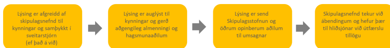
Mynd 1 Ferli og málsmeðferð lýsingar.

Lýsing skal vera aðgengileg á skrifstofu og á heimasíðu sveitarfélagsins. Í auglýsingu á að koma fram hvert og hvernig skila skuli inn ábendingum um efni lýsingarinnar og innan hvaða tímafrests.