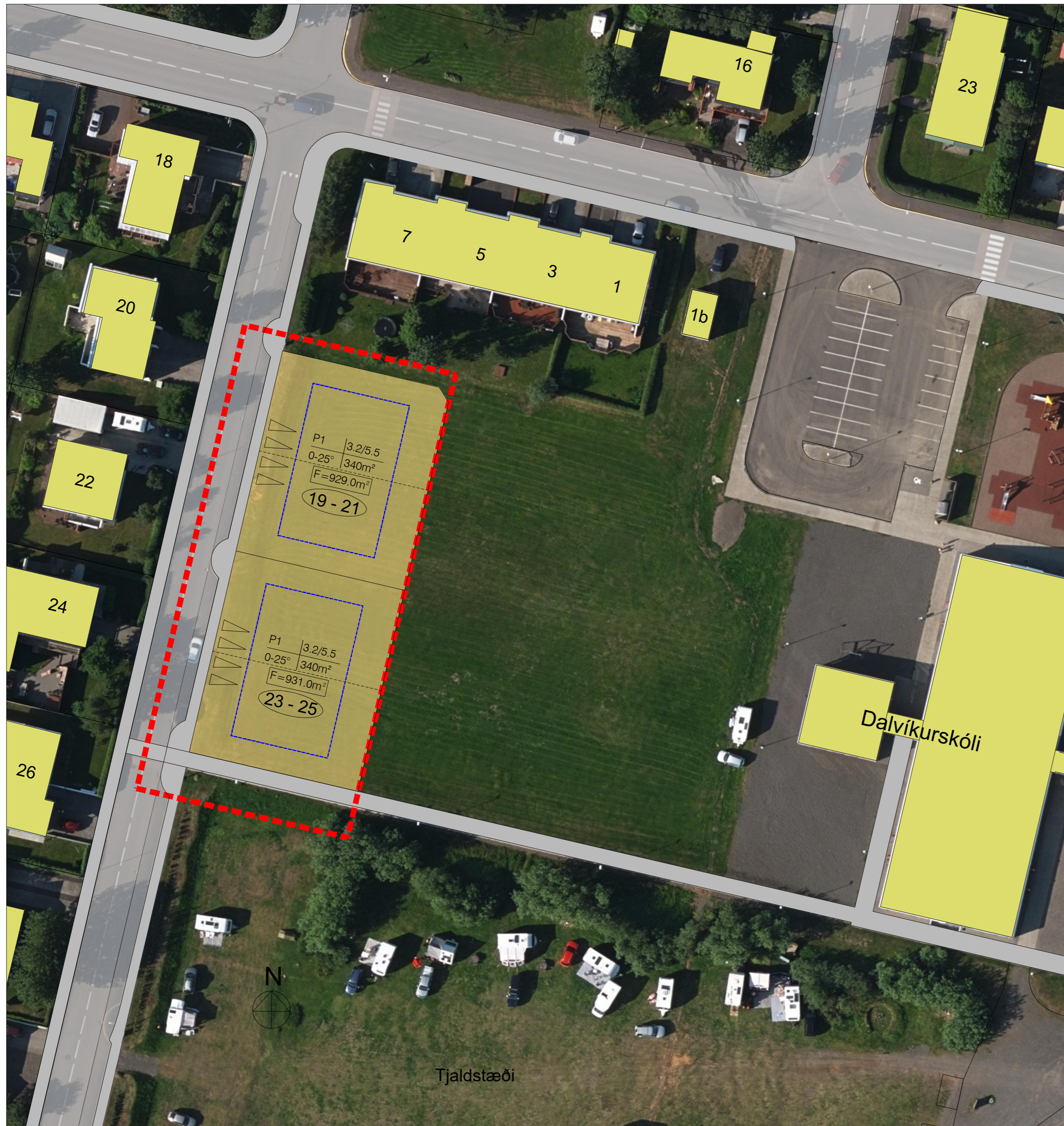
Deiliskipulagstillaga - afstöðumynd - mkv. 1:500